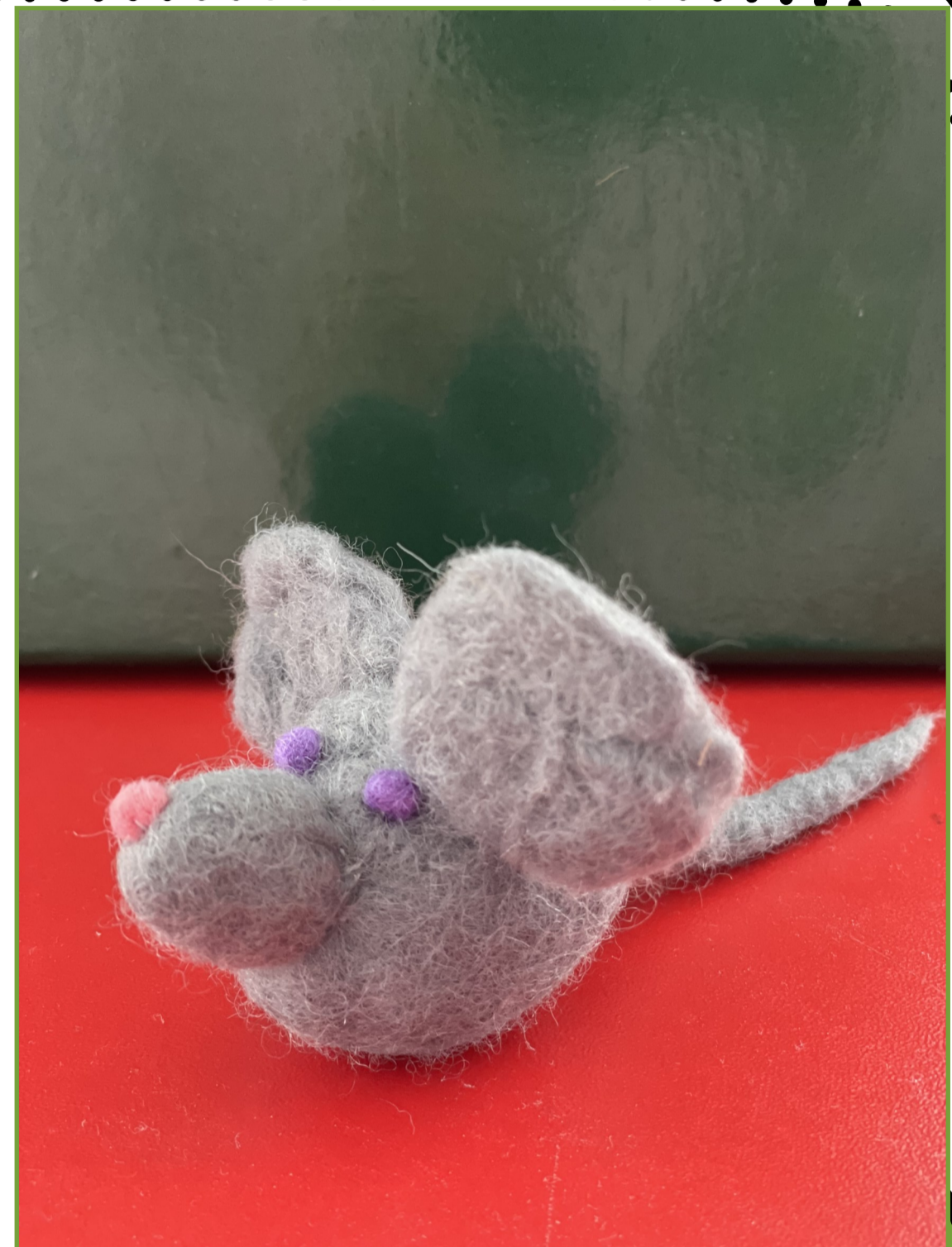
Подпись под картинкой