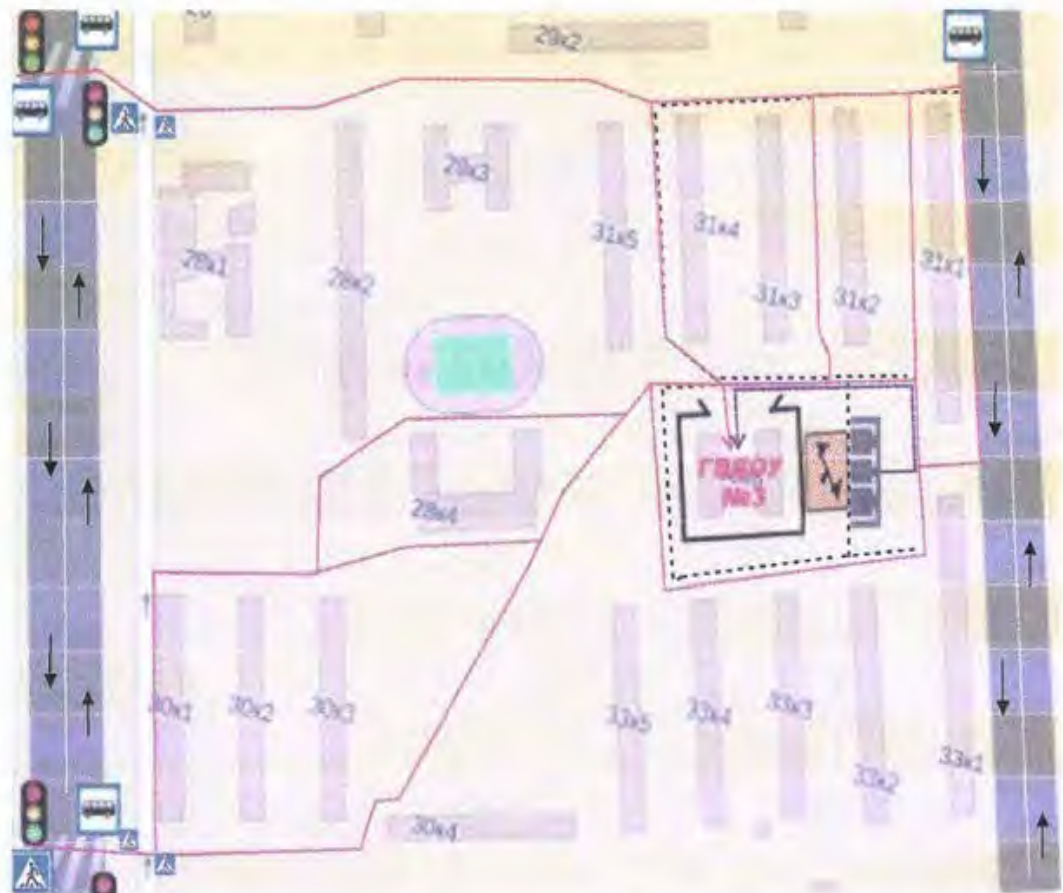
Схема организации дорожного движения в непосредственной близости от ГБОУ д/с № 3 с размещением соответствующих технических средств, маршруты движения детей и расположение парковочных мест